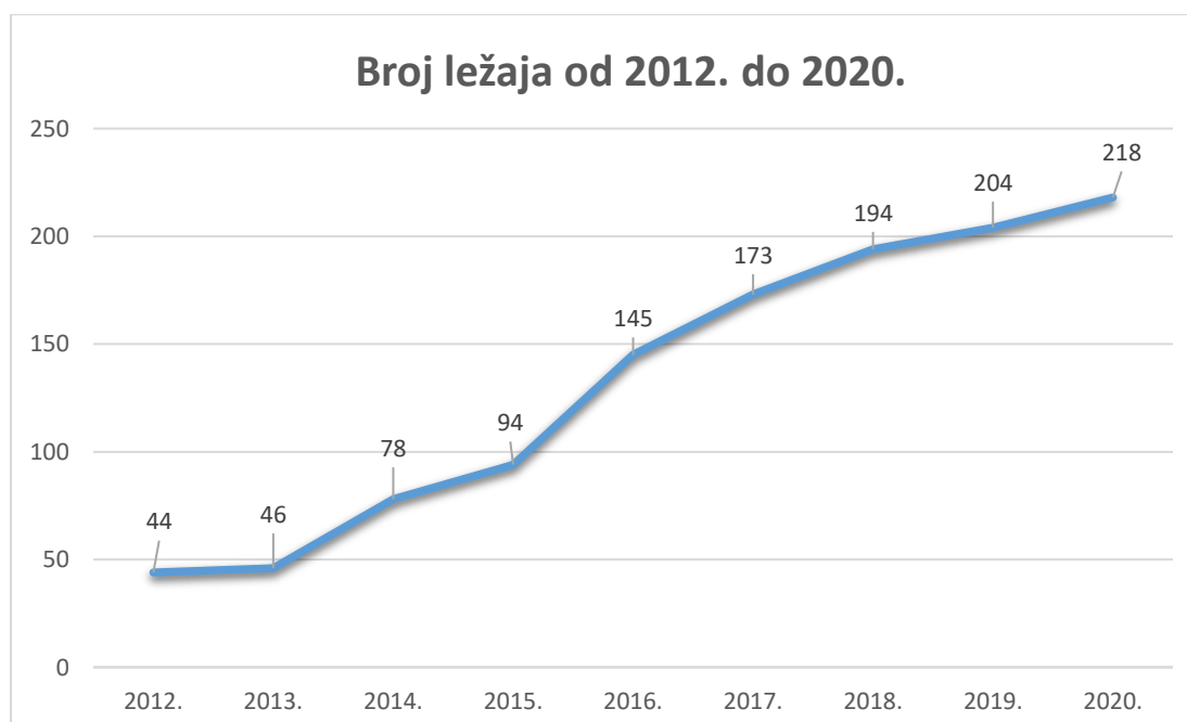
Grafikon 2. Broj ležaja u smještajnim kapacitetima od 2012. godine